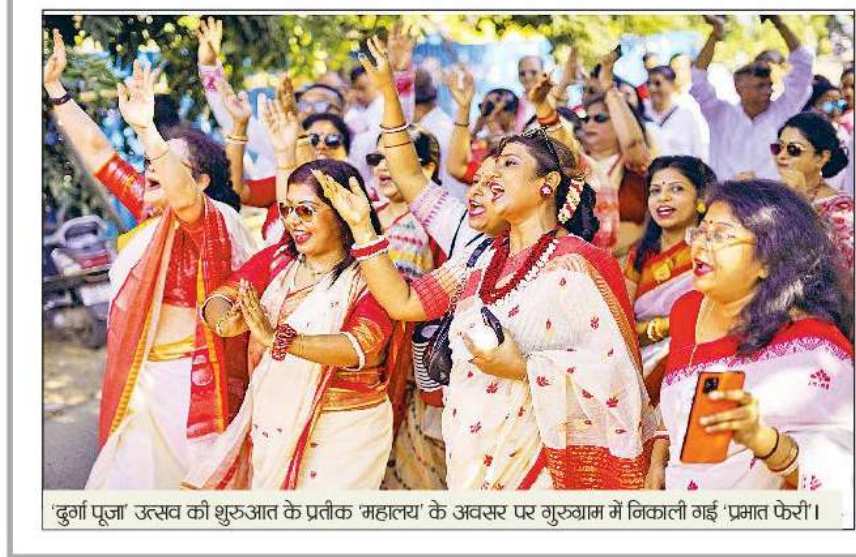
'दुर्गा पूजा' उत्सव की शुरुआत के प्रतीक 'महालय' के अवसर पर गुरुग्राम में निकाली गई 'प्रभात फेरी'।