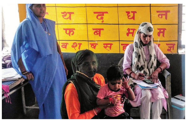
टीकाकरण के लिए रजिस्ट्रेशन-सीएमएचओ ने आमजन से अपील कि है कि अभिभावक अपने बच्चों को मीजल्स-रूबेला का टीका अवश्य लगावाएं। इसके लिए अभिभावक स्वयं भी यूनिट पर रजिस्ट्रेशन करा अपाईटमेंट बुक करा सकते हैं। इसकी पहली खुराक 9 से 12 माह और दूसरी खुराक 16 से 24 माह पर दी जाती है।