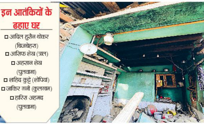
आतंकी जाकिर अहमद गनी का कुलगाम में घर ध्वस्त किया