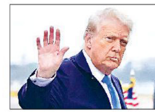
एजेसी ॥ वॉशिंगटन