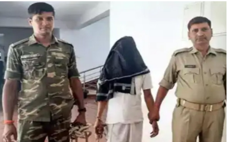
पुलिस हिरासत में भेज दिया है।

नई दिल्ली। जम्मू-कश्मीर के पहलगांम में हुए आतंकी हमले को लेकर सोशल मीडिया पर विवादित टिप्पणियों का सिलसिला तेज हो गया है। देश के 7 राज्यों से अब तक कुल 26 लोगों को गिरफ्तार किया गया है। इन गिरफ्तारियों में असम की विपक्षी पार्टी AIUDF के विधायक, एक पत्रकार, एक छात्र और एक वकील भी शामिल हैं। पुलिस ने इन सभी पर देशद्रोह, सांप्रदायिक विद्वेष फैलाने और आतंकवाद को महिमामंडित करने जैसे गंभीर आरोप लगाए हैं। कहाँ से कितनी गिरफ्तारियां हुईं? असम: 14 लोग