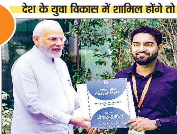
आज जलमार्गों की संख्या बढ़कर हो गई 110। एआई और नए मीडिया क्षेत्र युवाओं के लिए बड़े अवसर होंगे। पीएम ने मुंबई में 2025 में होने वाले वर्ल्ड ऑडियो विजुअल एंड एंटरटेनमेंट समिट का भी जिक्र किया। उन्होंने कहा कि यह आयोजन एआई और नए मीडिया क्षेत्र में युवाओं के लिए नए अवसर खोलेगा।

'नेतृत्व परिवर्तन मिशन' का किया निरूपण। पीएम ने केंद्रीय बजट में घोषित 'नेतृत्व परिवर्तन मिशन' की भी चर्चा की, जो मेक इन इंडिया अभियान की गति देगा और युवा उद्यमियों को वैश्विक प्रतिस्पर्धा वाले उत्पाद बनाने के लिए प्रेरित करेगा। उन्होंने बताया कि ऑटोमोबाइल, फुटवियर, खादी और कुटीर उद्योग जैसे क्षेत्रों में रिकॉर्ड वृद्धि दर्ज की गई है और खादी का कारोबार अब 1.7 लाख करोड़ से अधिक हो गया है।