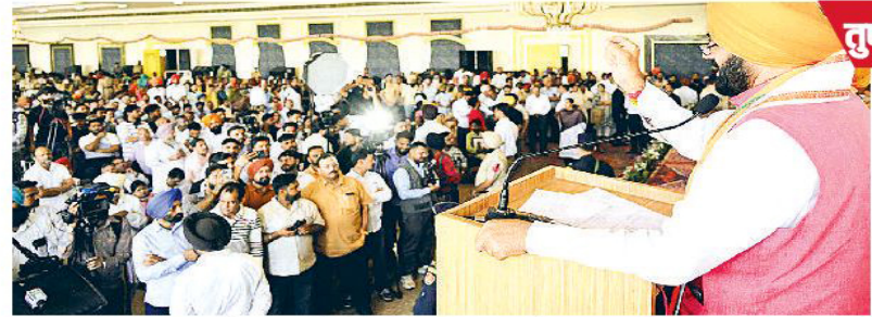
हरियाणा में घर बैठे मिल रहा योजनाओं का लाभ

कहा, हरियाणा की जन-कल्याणकारी योजनाओं को पंजाब में भी किया जाएगा लागू। हरियाणा में आज जवाबदेह और संवेदनशील नॉन स्टॉप सरकार कर रही है कार्य