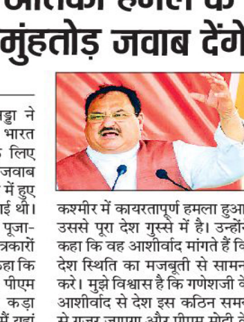
कश्मीर में कायरतापूर्ण हमला हुआ, उससे पूरा देश गुस्से में है। उन्होंने कहा कि वह आशीर्वाद मांगते हैं कि देश स्थिति का मजबूती से सामना करे। मुझे विश्वास है कि गणेशजी के आशीर्वाद से देश इस कठिन समय से गुजर जाएगा और पीएम मोदी के नेतृत्व में जिम्मेदार लोगों को करारा जवाब दिया जाएगा।

भाजपा के अध्यक्ष जेपी नड्डा ने शनिवार को कहा कि भारत पहलगांम आतंकी हमले के लिए जिम्मेदार लोगों को 'करारा' जवाब देगा। इस सप्ताह की शुरुआत में हुए हमले में 26 लोगों की मौत हुई थी। श्रीमंत द्वाइशेट गणपति की पूजा-अर्चना करने के बाद यहाँ पत्रकारों के साथ बातचीत में नड्डा ने कहा कि पूरा देश उम्मीद करता है कि पीएम नरेंद्र मोदी इस हमले का कड़ा जवाब देंगे। नड्डा ने कहा कि मैं यहां गणपति बप्पा का आशीर्वाद लेने आया हूँ। जिस तरह से जम्मू-