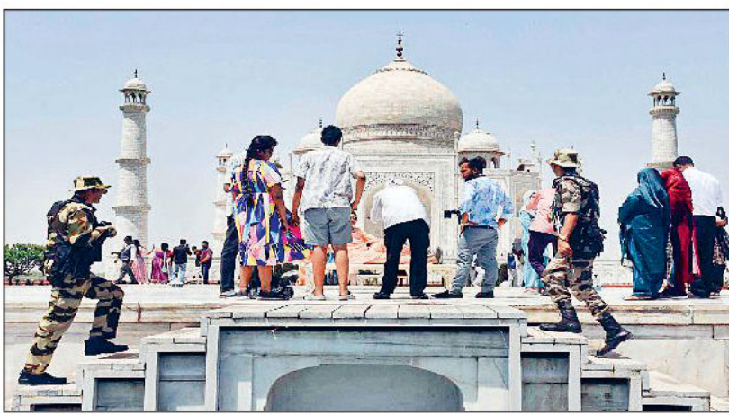
उत्तर प्रदेश के आगरा में ताजमहल पर मंगलवार को पहलगाव में हुए आतंकवादी हमले के बाद सुरक्षाकर्मी चौकसी बरत रहे हैं। इस हमले में 26 लोग मारे गए थे।