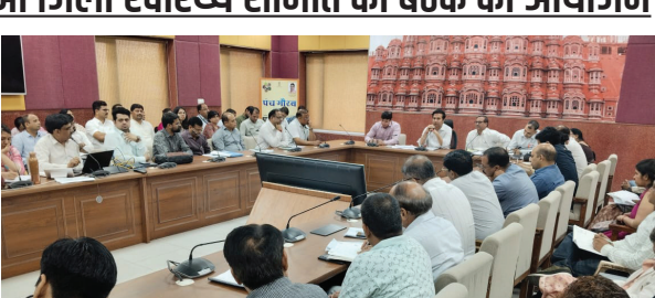
जिले में 24 अप्रैल को प्रारंभ हुए विश्व टीकाकरण सप्ताह पर चर्चा हुई, जिसमें बच्चों व लाभार्थियों को विभिन्न बीमारियों से बचाव हेतु टीके लगाए जाएंगे। जिले में टीबी मुक्त अभियान पर चर्चा हुई। मौसमी बीमारियों पर चर्चा के दौरान आगामी दिवसों में एंटी लार्वा गतिविधियों व लू तापघात से बचाव के लिए आवश्यक तैयारियां सुनिश्चित किए जाने के निर्देश दिए। पर गौरव अभियान के तहत उन्होंने सभी संस्थानों पर बैनर इत्यादि के माध्यम से अधिकाधिक प्रचार प्रसार के निर्देश दिए। राजश्री योजना की द्वितीय क्रिस्ट अपडेट करने के निर्देश दिए। तम्बाकू के प्रति व्यापक जागरूकता व नियमित रूप से चालान किये जाने के निर्देश दिए। उन्होंने गुड सेमेरिटन व मिशन मधुहारी कार्यक्रम के प्रति जागरूकता बढ़ाने के निर्देश दिए। उन्होंने नानाका गाडियों को कंडम करने के निर्देश दिए। बैठक में राष्ट्रीय बाल स्वास्थ्य मिशन कार्यक्रम की समीक्षा हुई। एनसीडी कार्यक्रम पर चर्चा हुई। साथ ही लाडो योजना, पीसीपीएनडीटी, एनीमिया कार्यक्रम, आईएचएपी पोर्टल, एएनसी, पीएनसी में कार्य प्रसव की रिपोर्ट और लाइनलिस्ट की समीक्षा की गई। साथ ही आभा आईडी, एमएनडीवी और एमएनजेवाई योजना, मां वाउचर योजना, प्रधानमंत्री सुरक्षित मातृत्व कार्यक्रम, परिवार कल्याण, जेएसवाय योजना, टीकाकरण कार्यक्रम सहित अन्य स्वास्थ्य कार्यक्रमों पर चर्चा हुई।