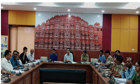
नये साइनेज लगाने के निर्देश दिये। जिला कलक्टर ने यातायात नियमों का उल्लंघन करने वालों के खिलाफ अधिकारियों को सख्त कार्यवाही करने के लिए निर्देशित किया। उन्होंने जयपुर जिले के शहरी, ग्रामीण क्षेत्र के राष्ट्रीय एवं राज्य मार्गों पर भारत सरकार के नये नोटिफिकेशन के अनुसार स्पीड लिमिट के साइनेज बोर्ड लगाने, राजमार्गों के प्रोटोकॉल के अनुसार चिन्हित ब्लैक स्पॉट्स के निवारण करने एवं जिले में यातायात नियमों की पालना सुनिश्चित करने और राजमार्गों पर अनाधिकृत पार्किंग सहित रिफ्लेक्टिव टेप इत्यादि के उल्लंघनों के विरुद्ध प्रभावी कार्यवाही करने के निर्देश दिये। साथ ही जयपुर विकास प्राधिकरण और राजस्थान राज्य सड़क विकास निगम के अधिकारियों को पिछली बैठक के बिन्दुओं की अनुपालना रिपोर्ट पेश करने के लिए निर्देशित किया गया है। बैठक में जलनशील पदार्थों को ले जाने वाले वाहनों की जीपीएस ट्रैकिंग करने, रूट उल्लंघन करने वालों के खिलाफ आवश्यक कार्रवाई करने, टोल नाके पर शराब या नशा कर के चलाने वाले वाहन चालकों को पकड़ने तथा बेसहारा पशुओं को रेडियम पट्टी लगाने सहित सड़क सुरक्षा के तमाम उपाय करने आदि पर भी चर्चा की गई।