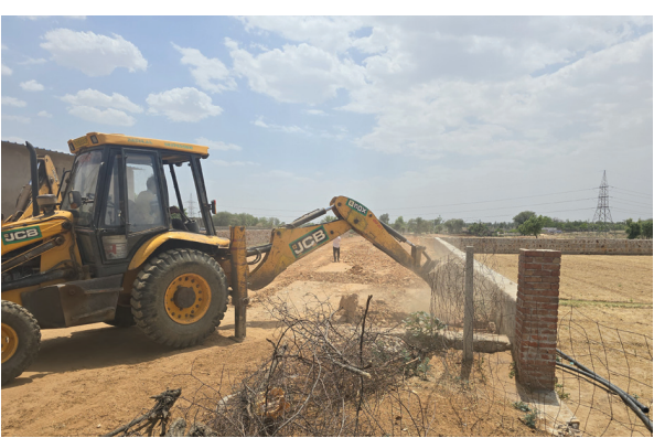
कृषि भूमि पर जेडीए की बिना स्वीकृति-अनुमोदन के एवं बिना भू रूपांतरण करवाये भूमि को समतल कर "विनायक विहार" के नाम से बनाई गई मिट्टी-ग्रेवल सडकें, पत्थरगद्दी व अन्य अर्धेध निर्माण कर नवीन अर्धेध कॉलोनियों बसाने की सूचना प्राप्त होने पर आज जून-13 के राजस्व व तकनीकी स्टॉफ की निशादेही पर प्रवर्तन दस्ते द्वारा जेसीबी मशीन व मजदूरों की सहायता से ध्वस्त किया जाकर नवीन अर्धेध कॉलोनियों बसाने के प्रयास को विफल किया गया। जेडीए द्वारा जून-09 के क्षेत्राधिकार में अवस्थित ग्राम सिंदोली, जिला जयपुर में करीब 07 बीघा निजी खातेदारी कृषि भूमि पर जेडीए की बिना स्वीकृति-अनुमोदन के एवं बिना भू रूपांतरण करवाये भूमि को समतल कर बनाई गई मिट्टी-ग्रेवल सडकें, प्लांटों की बाउण्ड्रीवाल व अन्य अर्धेध निर्माण कर नवीन अर्धेध कॉलोनियों बसाने की सूचना प्राप्त होने पर आज जून-09 के राजस्व व तकनीकी स्टॉफ की निशादेही पर प्रवर्तन दस्ते द्वारा जेसीबी मशीन व मजदूरों की सहायता से ध्वस्त किया गया।

जयपुर, (रॉयल पत्रिका)। जयपुर विकास प्राधिकरण द्वारा जून-13 में निजी खातेदारी की करीब 25 बीघा कृषि भूमि पर 02 नवीन अर्धेध कॉलोनियों को पूर्णतः ध्वस्त किया गया। जून-9 में निजी खातेदारी की करीब 11 बीघा कृषि भूमि पर 02 नवीन अर्धेध कॉलोनियों को पूर्णतः ध्वस्त किया गया। साथ ही जून-पीआरएन-साउथ में तिरूपति विहार के भूखण्ड संख्या 183 में किये गये अर्धेध निर्माण के विरुद्ध ध्वस्तीकरण की कार्यवाही की गई। जून-4 में दुर्गापुरा के पास, एयरपोर्ट-एन्क्लेव कॉलोनी में रोड सीमा को कब्जा-अतिक्रमण मुक्त करवाया।