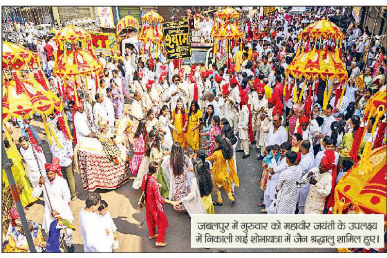
जबलपुर में गुरुवार को महावीर जयंती के उपलक्ष्य में निकाली गई शोभायात्रा में जैन श्रद्धालु शामिल हुए।