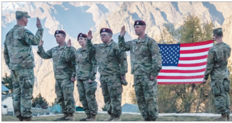
संचालन प्रमुख एडमिरल लिसा फ्रेंचेटो, वायुसेना के उप प्रमुख जनरल जिम स्लाइफ और सैन्य सेवाओं के लिए जज एडवोकेट जनरल को हटा दिया। हेगसेथ ने ब्राउन की बर्खास्तगी का बचाव करते हुए कहा कि अन्य राष्ट्रपतियों ने भी

४४ वरिष्ठ सैन्य अफसरों को बर्खास्त करने के फैसले को बर्खास्त करने के मामले में कांग्रेस से तत्काल सुनवाई करने का आग्रह किया है। एसीएसिटेड प्रेस के पास उपलब्ध एक पत्र से यह जानकारी सामने आई। पांचों व्यक्तियों - जिन्होंने पिछले तीन दशकों से रिपब्लिकन और डेमोक्रेटिक प्रशासन का प्रतिनिधित्व किया है - ने कहा कि बर्खास्तगी शिष्टाचार के अंत में वायुसेना के जनरल सीधु ब्राउन जूनियर को जवाइंट चीफ्स के अध्यक्ष पद से हटा दिया। इसके बाद रक्षा मंत्री पीट हेगसेथ ने नौसेना