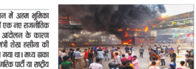
लोग हमारे उद्घाटन समारोह में शामिल होंगे। उन्होंने कहा, हमने प्रमुख राजनीतिक दलों के नेताओं को भी आमंत्रित किया है। नई पार्टी की शुरुआत युवस के समर्थन से की जा रही है, जिन्होंने अगस्त 2024 में एसएसी के उम्मीदवार के रूप में मुख्य सलाहकार का पद संभाला था। एनपीपी नेताओं ने कहा कि युवस भी उनके स्थापना समारोह में आमंत्रित है। अन्य उच्च-स्तरीय आमंत्रित हस्तियों में बांग्लादेश नेशनलिस्ट पार्टी (बीएनपी) की अध्यक्ष और पूर्व प्रधानमंत्री खालिदा जियाउ उनकें पुत्र और कार्यवाहक बीएनपी अध्यक्ष तारिक रहमानउ बीएनपी महासचिव मिर्जा फखरुल इस्लाम आलमगीरअ जमात-ए-इस्लामी के अमीर शफीकुर रहमान और कई इस्लामी, दक्षिणपंथी और वामपंथी दलों और समूहों के नेता शामिल हैं।