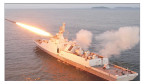
में कहा गया है कि किम ने परीक्षण के परिणामों पर संतोष व्यक्त करते हुए कहा कि सेना को युद्ध तथा अपने परमाणु हथियारों का इस्तेमाल करने के लिए हमेशा तैयार रहना चाहिए। उत्तर कोरिया के रक्षा मंत्रालय ने पिछले शनिवार को आरोप लगाया था कि ट्रंप के सत्ता में आने के बाद से अमेरिका और उसके सहयोगी उत्तर कोरिया को निशाना बनाकर और गंभीर सैन्य उकसावे की कार्रवाई कर रहे हैं। रिपोर्ट

उत्तर कोरिया ने परमाणु हमले की स्थिति में जवाबी कार्रवाई करने की अपनी धमका प्रदर्शन करने के लिए सामरिक रूप से अहम क्रूज मिसाइल के परीक्षण का शुक्रवार को दावा किया। इससे कुछ ही दिन पहले उत्तर कोरिया ने अमेरिका से बढ़ते खतरे का जवाब देने का संकल्प लिया था। अधिकारियों कोरियन सेप्टल न्यूज एजेंसी ने कहा कि उत्तर कोरिया के नेता किम जोंग उन ने बुधवार को देश के पश्चिमी तट पर मिसाइल परीक्षणों की निगरानी की। यह उत्तर कोरिया का इस साल चौथा और अमेरिका के राष्ट्रपति के रूप में डोनाल्ड ट्रंप के दूसरे कार्यकाल में दूसरा मिसाइल प्रक्षेपण कार्यक्रम है।