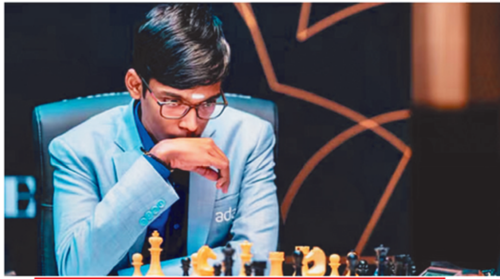
प्राग मास्टर्स 2025

नई दिल्ली, एजेंसी। तकरवीबन 29 साल बाद पाकिस्तान को किसी आइसीसी टूर्नामेंट्स की मेजबानी मिली। चैंपियंस ट्रॉफी 2025 की मेजबानी पाकिस्तान कर रहा है। लेकिन टूर्नामेंट शुरू होने के महद 5 दिनों बाद पाकिस्तान का सफर समाप्त हो गया। मोहम्मद रिजवान की कप्तानी वाली पाकिस्तान को न्यूजीलैंड और भारत के खिलाफ हार का सामना करना पड़ा। जबकि बांग्लादेश और पाकिस्तान का मैच बारिश की भेंट चढ़ गया। बहरहाल, चैंपियंस ट्रॉफी में चट्टिया प्रदर्शन के बाद पाकिस्तान टीम की लगातार फजीहत हो रही है। वहीं, बाबर आजम सबसे ज्यादा आलोचकों के निशाने पर हैं।